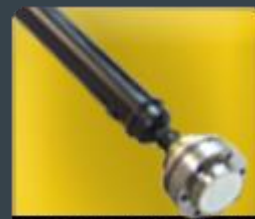
ARBRES DE TRANS