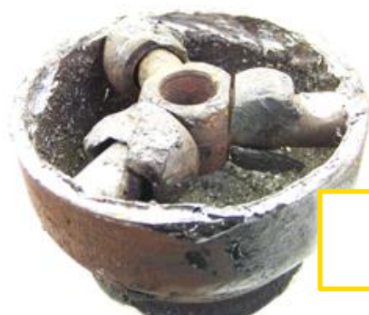
Bol et/ou tripode endommagés